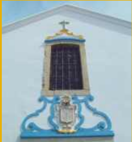
Capela da Misericórdia

No espaço museológico da Capela poderemos acompanhar o andamento dos trabalhos de recuperação do Castelo, ficando patente uma das telas dos tectos da Alcáçova que já se encontra devidamente restaurada, bem como algumas peças provenientes das escavações recentes, especialmente algumas pedras lavradas da época visigótica que nunca foram mostradas ao público.