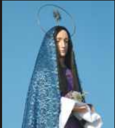
Nossa Senhora da Soledade