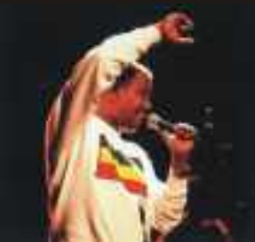
Mahmoud Ahmed (Etiópia)