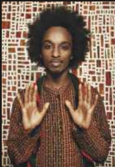
K'naan fala com o público do festival.