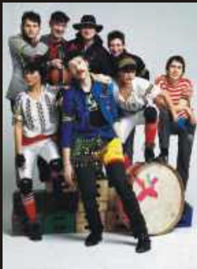
Gogol Bordello (EUA/Ucrânia)

Da metade oeste da Europa, a música também é de luxo. Os premiados Bellowhead vêm ao Castelo demonstrar porque são o melhor que aconteceu à folk britânica neste início de século. Na Praia, La Etruria Criminale Banda abre novos caminhos à música tradicional italiana. Da sempre interessante Bretanha, ouvi-