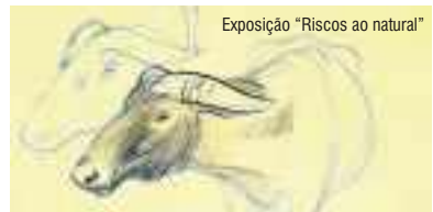
Exposição “Riscos ao natural”

Seleção de obras de um dos artistas portugueses com maior número de álbuns de banda desenhada produzidos (68 álbuns ilustrados, 39 dos quais em histórias aos quadrinhos até meados de 2001).