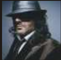
Rachid Taha (Argélia)