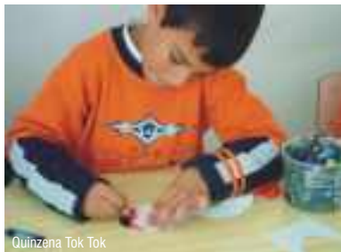
Quinzena Tok Tok

Neste atelier de Banda Desenhada, o Centro de Artes propõe aos mais novos uma viagem pela