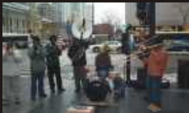
Animação de rua pela Hypnotic Brass Ensemble.