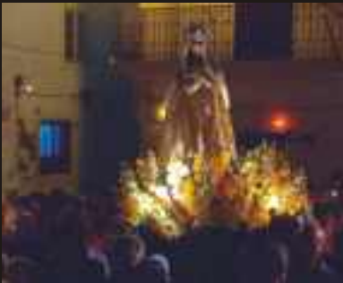
Procissão de Nossa Senhora das Salas

O dia da padroeira de Porto Covo, Nossa Senhora da Soledade, é 29 de Agosto. Ao fim da tarde desse dia, o povo leva a imagem em procissão pelas principais ruas da aldeia. As festas religiosas são acompanhadas por um programa de celebrações “profanas” na freguesia, que inclui o famoso “Banho 29”, fogo-de-artifício, bailes / espectáculos, feira e muito mais. As datas e horários das iniciativas serão detalhadas num programa próprio.