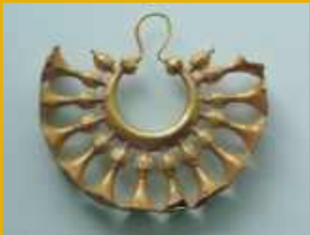
Arrecada do Tesouro do Gaio, uma das principais atracções do museu