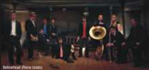
Bellowhead (Reino Unido)