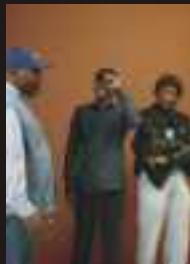
Bitty McLean / Sly & Robbie