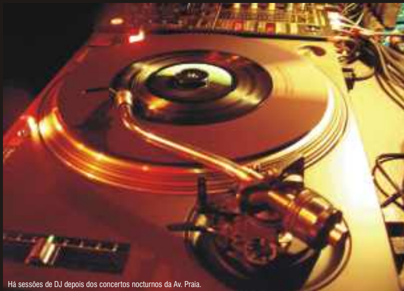
Há sessões de DJ depois dos concertos nocturnos da Av. Praia.