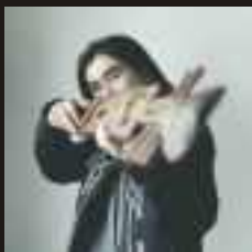
Ok! Dub Ainu Band (Japão)