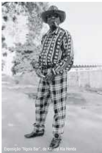
Exposição "Ngola Bar", de Kiluanji Kia Henda

1 Julho - 30 Setembro | Centro de Artes de Sines - C. Exposições | Inaug. 1 Julho, 19h00 | Todos os dias, 14h00-20h00 | Visitas guiadas sob marcação | Org. Câmara Municipal de Sines