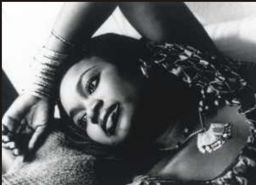
Oumou Sangaré (Mali)