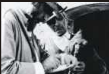
Será projectada uma selecção da série “Povo que Canta”