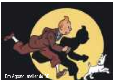
Em Agosto, atelier de BD

história da BD e uma incursão nos métodos e técnicas elementares de produzi-la.