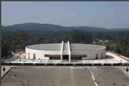
Igreja da Santíssima Trindade (Fátima)

O Passeio da Primavera 2008, para maiores de 55 anos, realiza-se este ano, nos primeiros três domingos de Junho, ao património arquitectónico e religioso do Oeste, com visita aos principais monumentos da zona Oeste, dos Mosteiros de Alcobaça e da Batalha até à nova Igreja da Santíssima Trindade, em Fátima. As inscrições vão estar a abertas no mês de Maio. Informe-se nos Espaços Seniores.